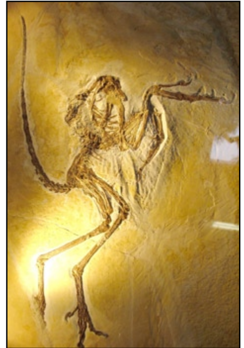
Jedan od 10 izloženih Archaeopteryxa

Prva je izložba okupila sve dosadašnje nalaze Archaeopteryxa pod jednim krovom, u posebno uređenom parku unutar paviljona (s vegetacijom, stijenama, otočićima i jezercima) gdje su se pravi fosili i modeli praptica izmjenjivali sa lubanjama i cijelim skeletima dinosaura iz Wyominga (SAD).